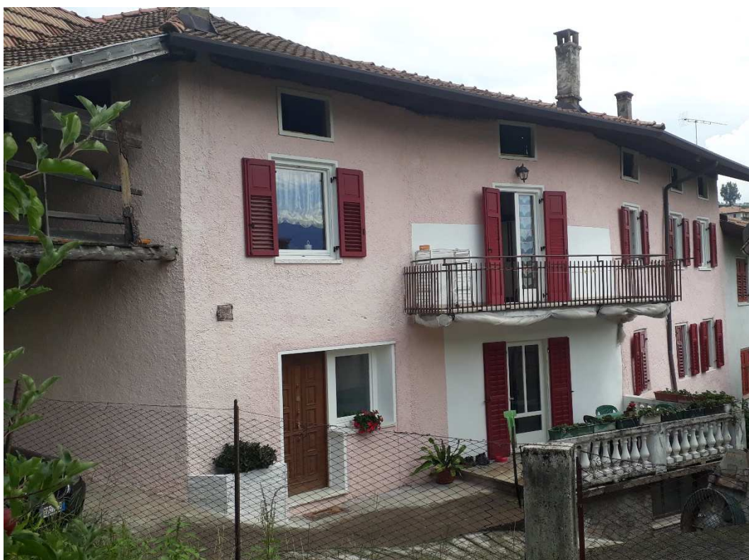
Vista da ovest