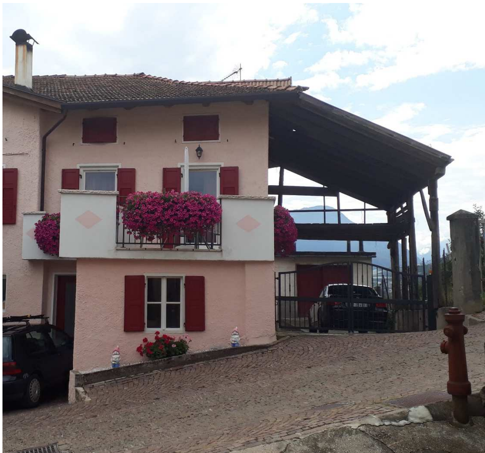
Vista da est